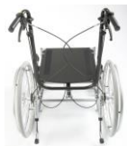
Compatible avec Matrix