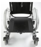
Assise réglable en profondeur