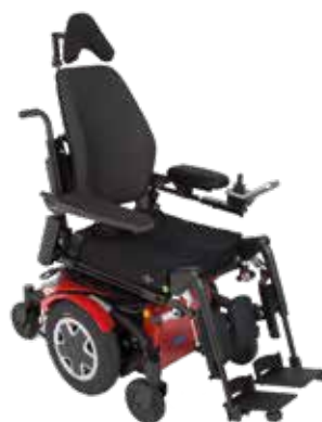
Invacare® TDX® SP2NB