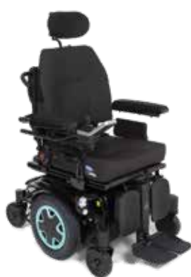
Invacare® TDX® SP2