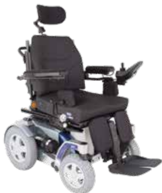
Invacare® Storm®4 et Storm®4 X-plore