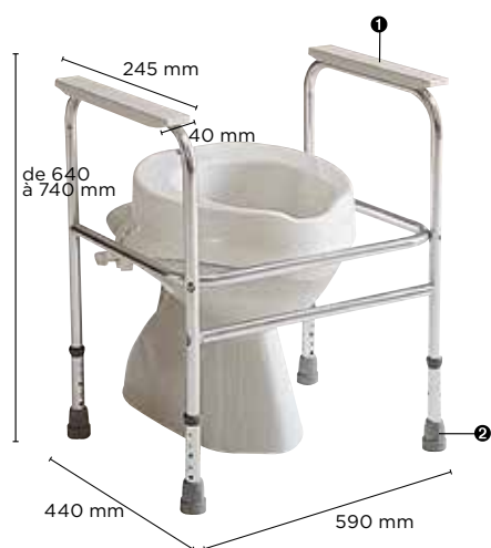
Invacare Adeo C407A