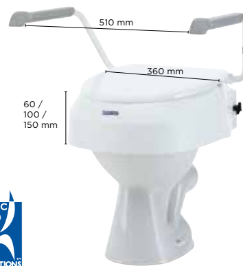
Aquatec 900 10128-10

Réhausse WC ajustable en hauteur. Réhausse le WC de 60, 100 ou 150 mm Facilité de transfert grâce aux accoudoirs relevables Disponible sans accoudoirs (réf. 10129-10) Livré avec accoudoirs en standard. Nouveau : Compatible désormais avec les cuvettes de toilette carrées et les WC suspendus.