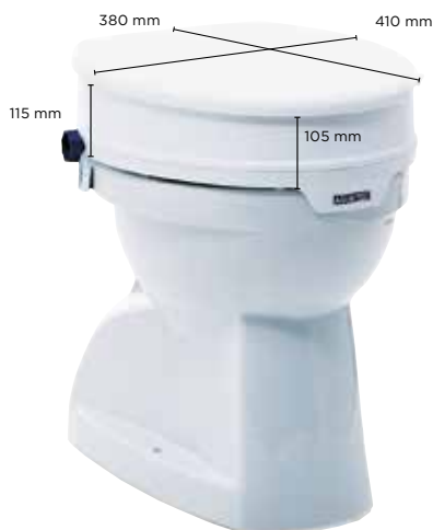
Aquatec 90 1470914, 1470915

Réhausse WC compatible avec tous les WC courants. - Réhausse l'assise de 100 mm - Simplicité de fixation au WC (butée à l'avant et 2 cales latérales) - Grande stabilité grâce aux antidérapants - Facilité de nettoyage grâce à l'abattant amovible - Disponible avec abattant (réf. 1470914) et sans abattant (réf. 1470915)