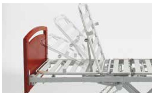
Relèvement-buste à translation afin d'atténuer les effets de friction.