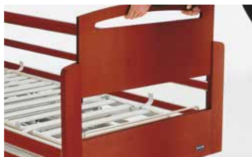
Panneau Victoria avec intérieur amovible pour faciliter les soins au niveau des pieds.