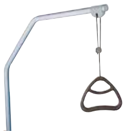
Potence de lit