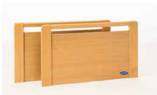
Panneau Susanne hêtre avec rail, pour barrières bois ou époxy.

Chaque partie du lit SB 755 est démontable et pèse moins de 25 Kg.