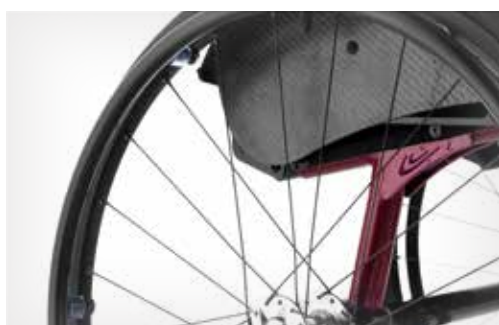
Superbes détails combinés à la précision suisse.