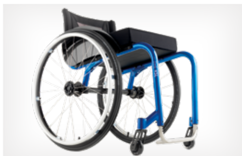
Épuré à l'extrême et ultra léger