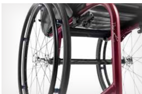
Design du châssis minimaliste