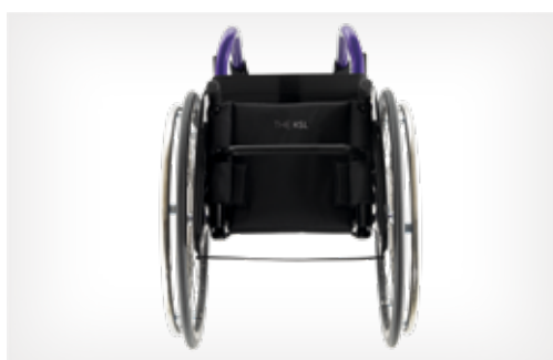
Disponible avec dossier fixe ou rabattable