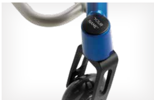
Bouchons de tête de fourche personnalisables, avec du texte ou un dessin