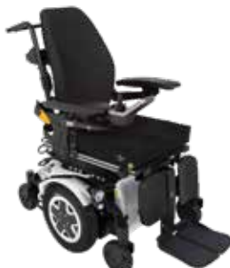
Invacare ® TDX ® SP2