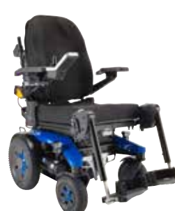
Invacare ® AVIVA RX20