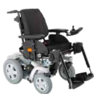
Invacare ® Storm ®4 et Storm ®4 X-plore

G-Trac apporte plus de plaisir et plus de confort durant la conduite de votre fauteuil Invacare ® .