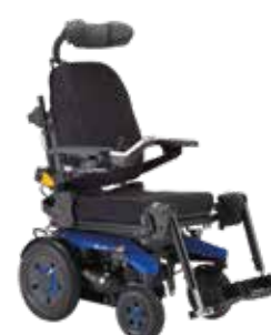
Invacare ® AVIVA RX40