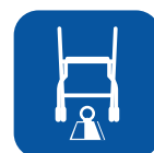
Poids net ▼