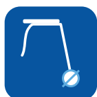
Diamètre des roues ▼