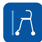
Hauteur hors-tout ▼