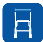
Largeur entre les poignées ▼