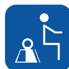
Poids max. utilisateur ▼