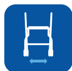
Largeur entre les roues ▼