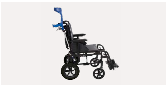
Invacare Action 3 NG Transit

Fauteuil léger configurable de confort et pliant par croisillon. Assise et dossier en revêtement PU bi-extensible noir. Dossier inclinable par vérins et coussin de dossier enveloppant pour un maintien optimal.