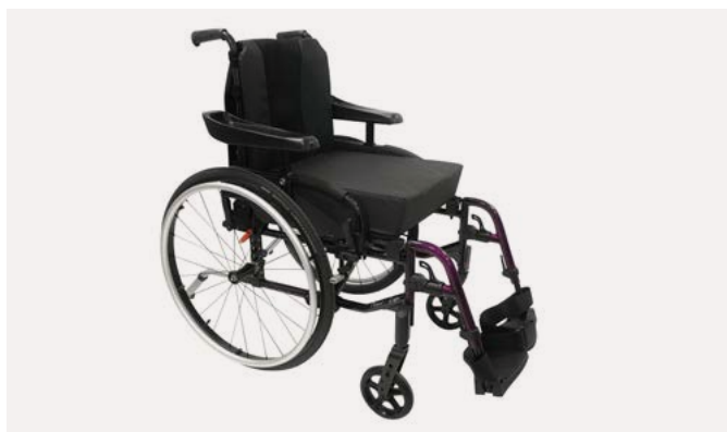
Invacare Action 3 NG Light Xtra

Le fauteuil le plus léger de la gamme Action 3 NG . Il offre de série des roues arrière Actives, des supports de fourche allégés en aluminium et une toile de dossier réglable en tension bi-matière noire incluant une pochette à l'arrière. Poids du fauteuil complet à partir de 13 kg !