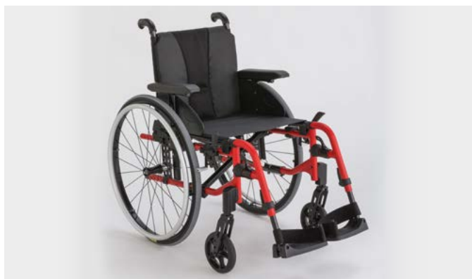
Invacare Action 3 NG Light

Le fauteuil le plus léger de la gamme Action 3 NG . Il offre de série des roues arrière Actives, des supports de fourche allégés en aluminium et une toile de dossier réglable en tension bi-matière noire incluant une pochette à l'arrière. Poids du fauteuil complet à partir de 13 kg !