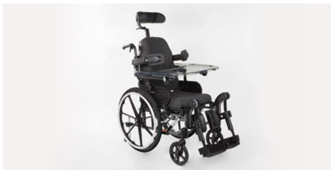
Invacare Action 3 NG Comfort

Fauteuil léger configurable de confort et pliant par croisillon. Assise et dossier en revêtement PU bi-extensible noir. Dossier inclinable par vérins et coussin de dossier enveloppant pour un maintien optimal.