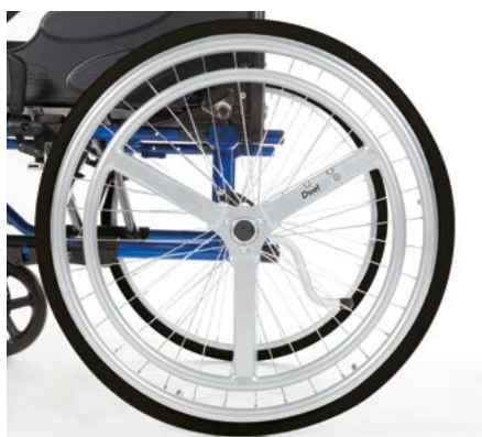
Invacare Action 3 NG Dual HR™

La version suréquipée du célèbre Action 3 NG Light qui offre de série : un dossier réglable en tension 4 sangles avec toile bi-matière rembourrée, une paire de gouttières étroites sans rotation – version courte, un coussin d'assise Matrx Contour Visco NG , une paire de roulettes anti-bascule et un kit accroche-taxi.