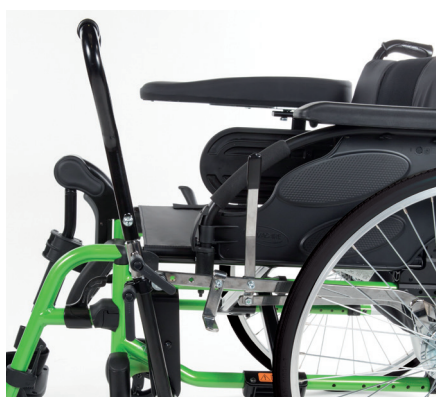
Invacare Action 3 NG Levier Pendulaire

Système breveté de double main courante doté d'un démontage rapide. La main courante intérieure est réservable pour s'adapter à chaque utilisateur. Désormais disponible en 22" et 24", compatible avec les hauteurs d'assise de 410 mm et 385 mm.