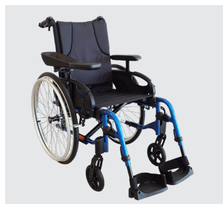
Invacare Action 3 NG Héli

Ce système de propulsion apporte aux utilisateurs ayant des capacités musculaires limitées la possibilité de se propulser avec un seul bras.