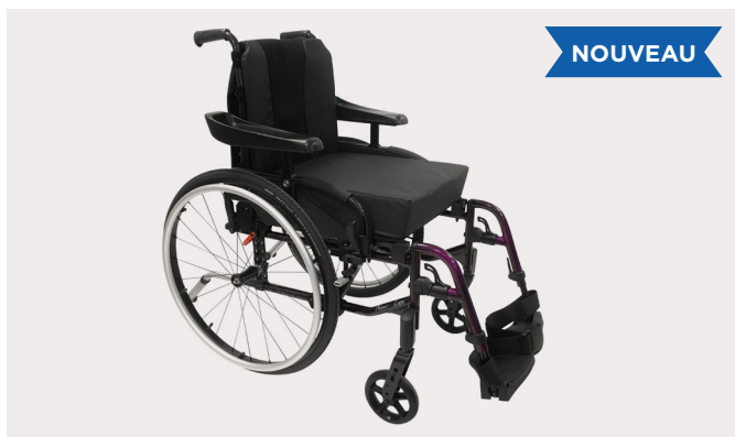
Invacare Action 3 NG Light Xtra

Le fauteuil le plus léger de la gamme Action 3 NG . Il offre de série des roues arrière Actives, des supports de fourche allégés en aluminium et une toile de dossier réglable en tension bi-matière noire incluant une pochette à l'arrière. Poids du fauteuil complet à partir de 13 kg !