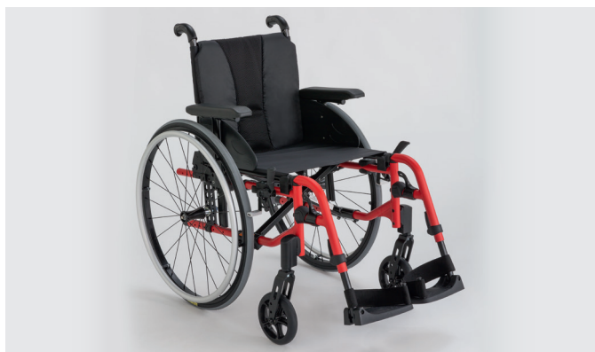
Invacare Action 3 NG Light

Le fauteuil le plus léger de la gamme Action 3 NG . Il offre de série des roues arrière Actives, des supports de fourche allégés en aluminium et une toile de dossier réglable en tension bi-matière noire incluant une pochette à l'arrière. Poids du fauteuil complet à partir de 13 kg !