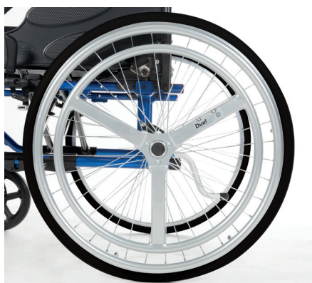
Invacare Action 3 NG Dual HR™

La version suréquipée du célèbre Action 3 NG Light qui offre de série : un dossier réglable en tension 4 sangles avec toile bi-matière rembourrée, une paire de gouttières étroites sans rotation – version courte, un coussin d'assise Matrx Contour Visco NG , une paire de roulettes anti-bascule et un kit accroche-taxi.