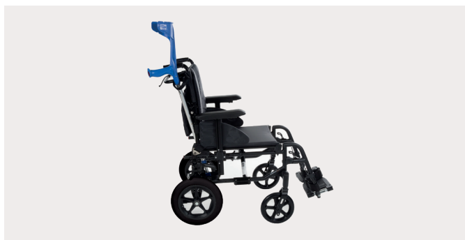
Invacare Action 3 NG Transit

Fauteuil léger configurable de confort et pliant par croisillon. Assise et dossier en revêtement PU bi-extensible noir. Dossier inclinable par vérins et coussin de dossier enveloppant pour un maintien optimal.