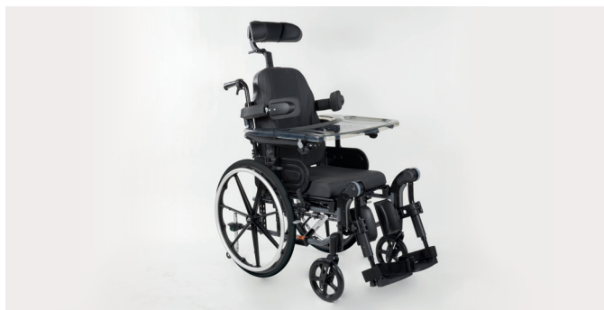
Invacare Action 3 NG Comfort

Fauteuil léger configurable de confort et pliant par croisillon. Assise et dossier en revêtement PU bi-extensible noir. Dossier inclinable par vérins et coussin de dossier enveloppant pour un maintien optimal.