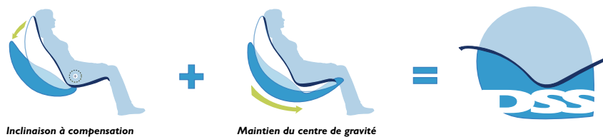
Inclinaison à compensation